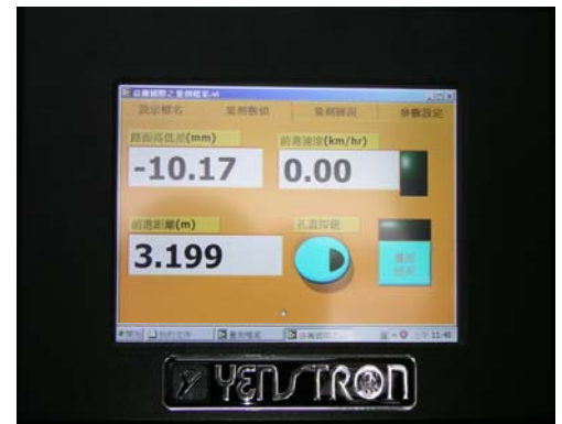
▲ 中文操作觸控式工業電腦